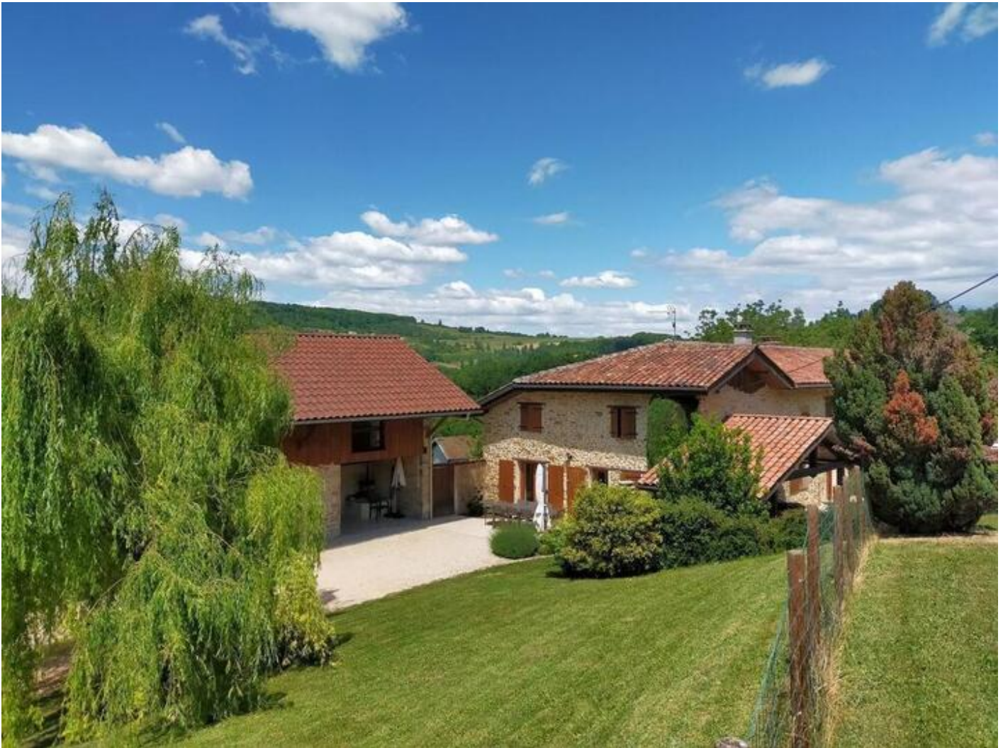
Les Séglières 38160 Montagne

Situé au calme à l'écart du village, gîte de caractère en pierres apparentes mitoyen à la maison du propriétaire, comprenant au r.d.c. : salon avec cheminée séjour cuisine, s. d'eau, wc. A l'étage : Ch.1 (1 lit 2 pers 160x200), Ch.2 (1 lit 2 pers 140x190), Ch.3 (1 lit 1 pers 90x190), Ch.4 (2 X 2 lits gigognes 1 pers 90x190), s.d.b.-wc. L-linge, s-linge, l-vaiss. M-ondes/grill, four élect. Tv, téléphone, wifi. Ch. central. Terrain clos avec pelouse, barbecue, salon de jardin & terrasse couverte. Sur place : terrain de volley, pétanque, trampoline, baby foot, ping pong, accès piscine chauffée des propr. entre mai et septembre. Départs sentiers balisés, VTT. A visiter : Village médiéval de St Antoine de l'Abbaye (classé plus beau village de France), jardin ferroviaire, Grottes de Choranche, lac de Roybon. Bateau à roue du Royans, musée de la chaussure de Romans, Marques avenue.